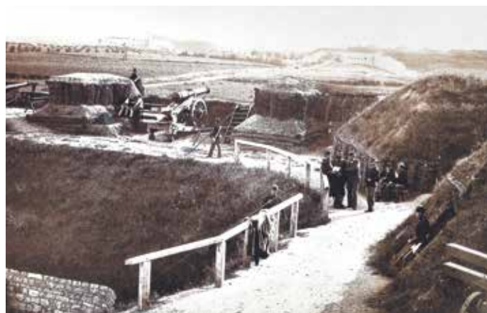
Forte Papa. Immagine del campo trincerato.

L'Area nasce in seguito all'entrata a pieno titolo della municipalità di Verona all'interno della rete, in un ambito di riorganizzazione interna della governance del MuDRi, sotto la guida della Provincia di Mantova cui si affianca, per i nostri territori, quella di Verona al fine di raccontare in maniera unitaria la storia di questo importante sistema difensivo: un racconto fatto di vittorie e sconfitte, di ideali e realtà, di uomini e di donne che hanno vissuto questo importante momento di passaggio per la storia collettiva ... in altre parole, cosa vuol dire "Vivere in Fortezza".